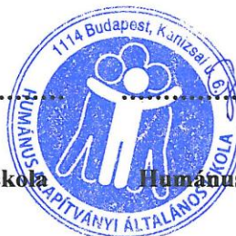
Gulyás Beáta igazgató helyettes