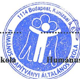
Gulyás Beáta igazgató helyettes